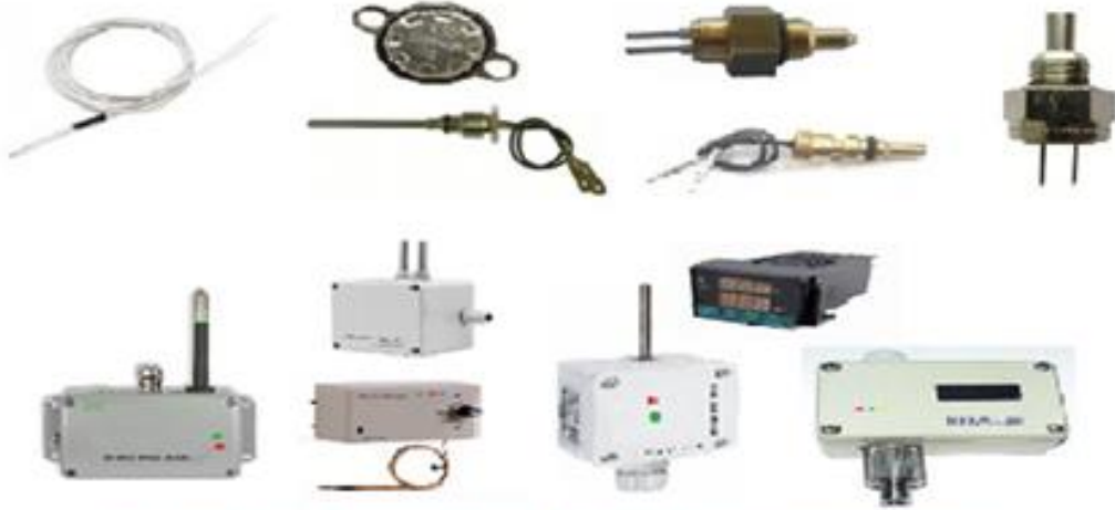
Isı , Sıcaklık ve Nem sensörleri , İndikatörleri ve kontrol sistemleri

İklimlendirme kontrol sistemlerinin Mekanik otomasyonunda temel amaç iklimlendirme ve tesisat düşünülerek tasarlanıp konulmuş mekanik cihazlara otomatik çalışma fonksiyonu kazandırmak ve merkezden izleme/kontrol yapılmasını sağlamaktadır